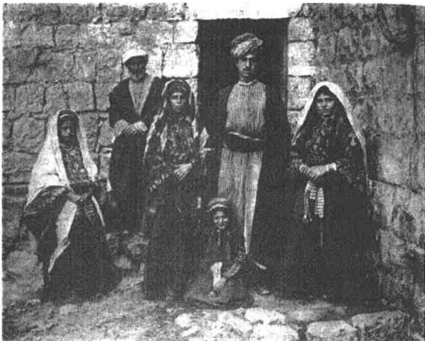
Figura 2. Uma família rural da zona de Ramallah no final da era otomana

Este não foi o último acto no teatro do absurdo que se desenrolava na sequência da desintegração do Império Otomano. Entraram ainda em cena mais dois actores. Um deles era a família hachemita, representada por Faysal, o filho do Sharif Husayn, que se tinha instalado em Damasco à revelia do Acordo Sykes-Picot. Ainda antes do final das hostilidades no Médio Oriente, na Primavera de 1918, Husayn e a sua família tiveram de encarar a dura realidade das promessas violadas na era do imperialismo moderno. Os filhos de Husayn e as suas tribos tinham-se aliado às forças britânicas, dando o seu contributo para o esforço militar dos Aliados através de uma espécie de guerra de guerrilha na retaguarda das forças convencionais. Não alteraram a correlação de forças militar, mas o facto de Husayn, detentor de uma das posições mais importantes no mundo muçulmano, estar do lado britânico era importante para contrabalançar a tentativa turca de desencadear uma guerra santa com o auxílio dos muçulmanos da Índia. Inicialmente Husayn previra a partilha dos despojos